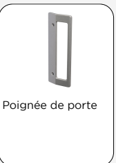
Poignée de porte