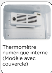
Thermomètre numérique interne (Modèle avec couvercle)