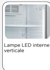
Lampe LED interne verticale